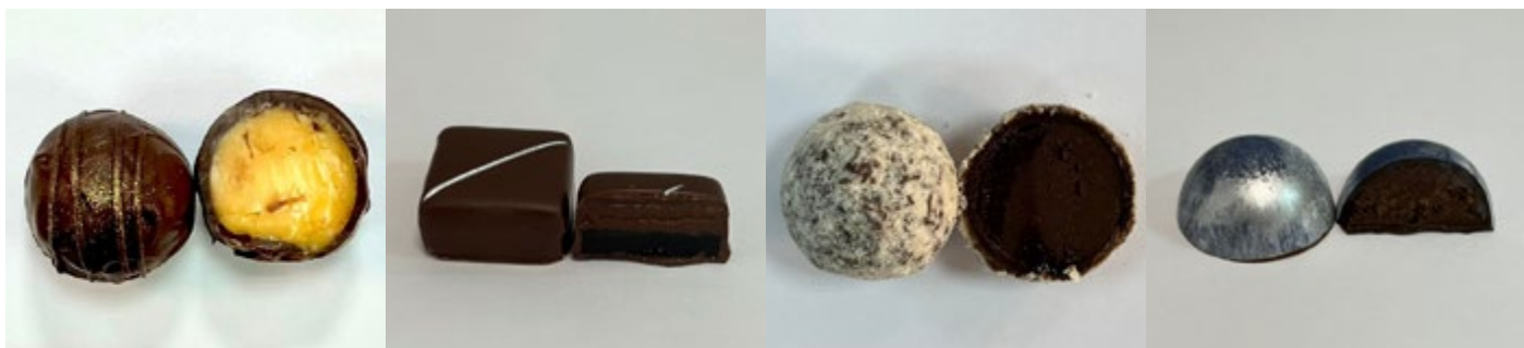
Варианты «северных» сладостей – от аспиранта УрГЭУ Шамиля Шамилова